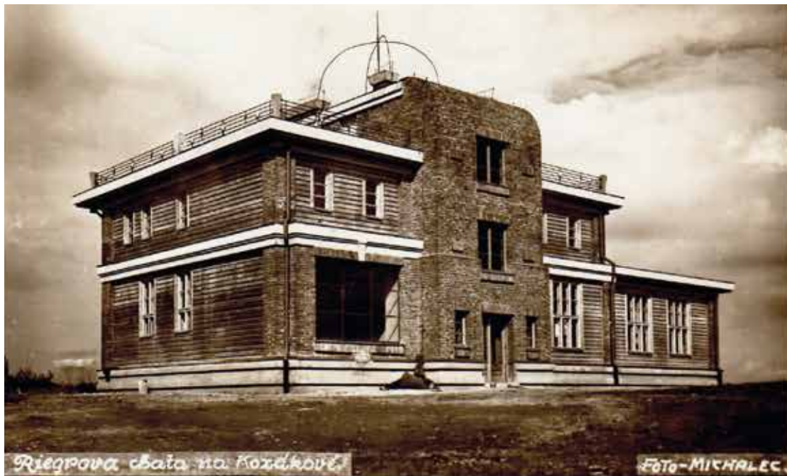
Riegrova chata na Kozákově (foto: archiv odboru)

v opravené chatě bylo útulno a celá se naplnila turisty. Zdeňka Marková uvítala hosty a uvedla hlavní bod programu oslavy – křest knihy Kozákov – příběh hory , na které se podílela řada místních autorů pod vedením Slavomíra Římana.