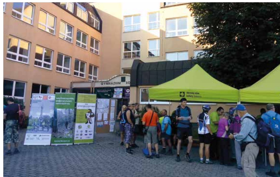
Ze startu pochodu