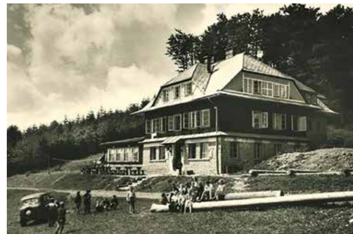
Nově postavená chata na Vsackém Cábu

KČT vyhlásil výběrové řízení na nájemce Bezručovy chaty na Lysé hoře. Podrobnosti najdete na http://www.kct.cz .