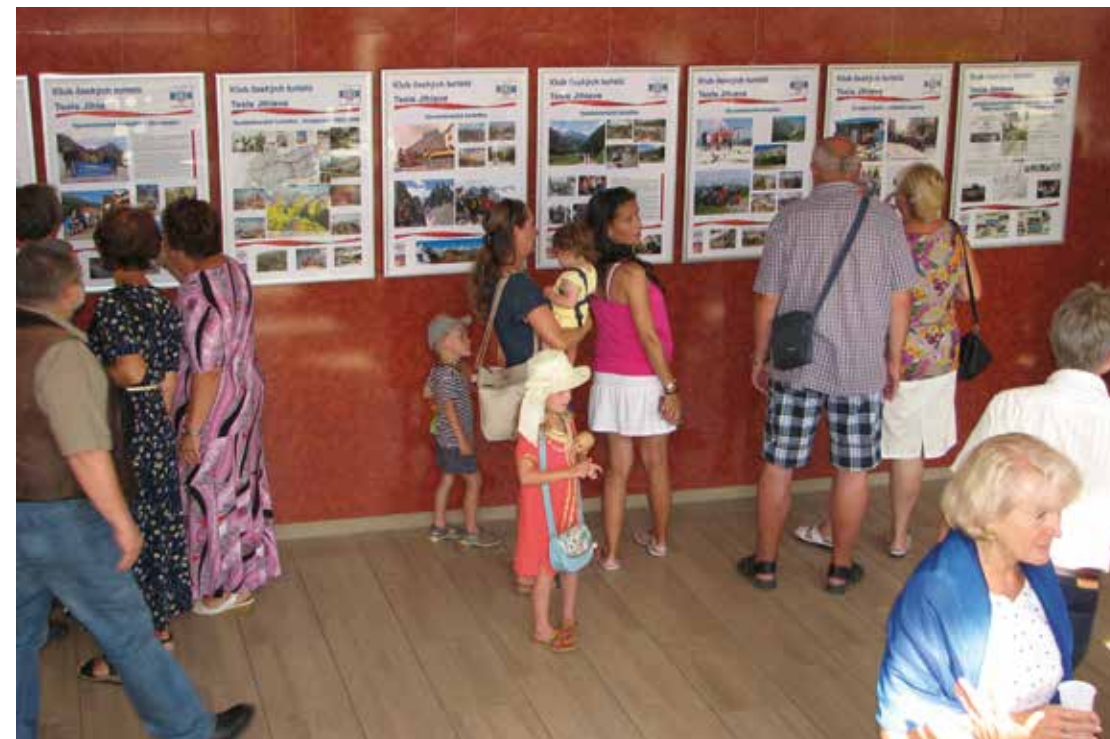
Z vernisáže výstavy