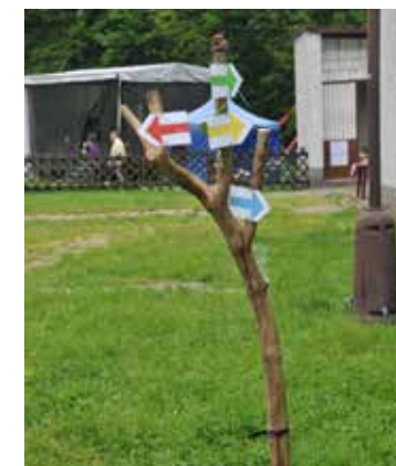
Šipky vytvořené dětmi na Dni s Lesy ČR

V sobotu 20. května 2017 okolí zámku Konopiště ožilo velkou celodenní akcí Lesů ČR. Klub českých turistů u toho nesměl chybět, vždyť Lesy ČR jsou naším generálním partnerem! Rodiče i děti se u nás zastavují a nejdřív jen tak okukují, jaké úkoly ve stánku KČT návštěvníci plní a co za to získávají. Dospělí se podivují, co vlastně