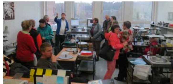
Prohlídka filmových ateliérů Zlín - Kudlov