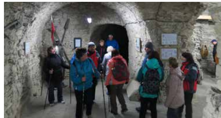
Prohlídka hradu v Brumově